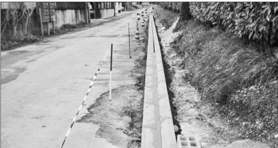
Pose des bordures rue du Bois Foucaud

Le gravillonnage va suivre et est prévu pour le mois de juin.