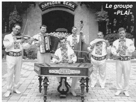
Le groupe «PLAĬ»

Une nouvelle tournée en Charente pour l'ensemble ukrainien «PLAĬ», invité par l'association «Art et Musique»