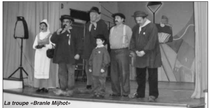
La troupe «Branle Mijhot»

Les quatre mousquetaires du patois ont su faire revivre les nostalgies passées, souvent à partir de préoccupations actuelles. Chacun a pu, peu ou prou, se reconnaître à travers les histoires d'une vie paysanne, après tout pas si lointaine.