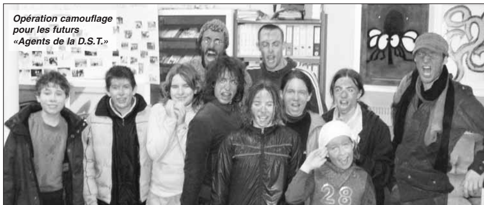
Opération camouflage pour les futurs «Agents de la D.S.T.»

L'exemple du club (10-13 ans) lors des dernières vacances qui a proposé durant deux semaines extraordinaires une véritable aventure pour de jeunes «recrues» : Il s'agissait pour 13 jeunes âgés de 10 à 13 ans de passer les différentes épreuves leur permettant d'obtenir leur diplôme «d'agent secret» ; épreuves aussi bien intellectuelles que physiques et sportives que les enfants ont réussies à enchaîner avec brio. Support et appréhension de nouvelles techniques au service d'un grand jeu, où les entraînements ont permis d'acquérir les connaissances nécessaires à la lecture de carte, à l'utilisation de la boussole, mais aussi à des notions de camouflages, de communication radio, le tout agrémenté d'épreuves physiques sur différents parcours variés. Une façon originale d'utiliser de nouvelles techniques et de se mettre dans la peau d'un vrai, d'un grand citoyen.