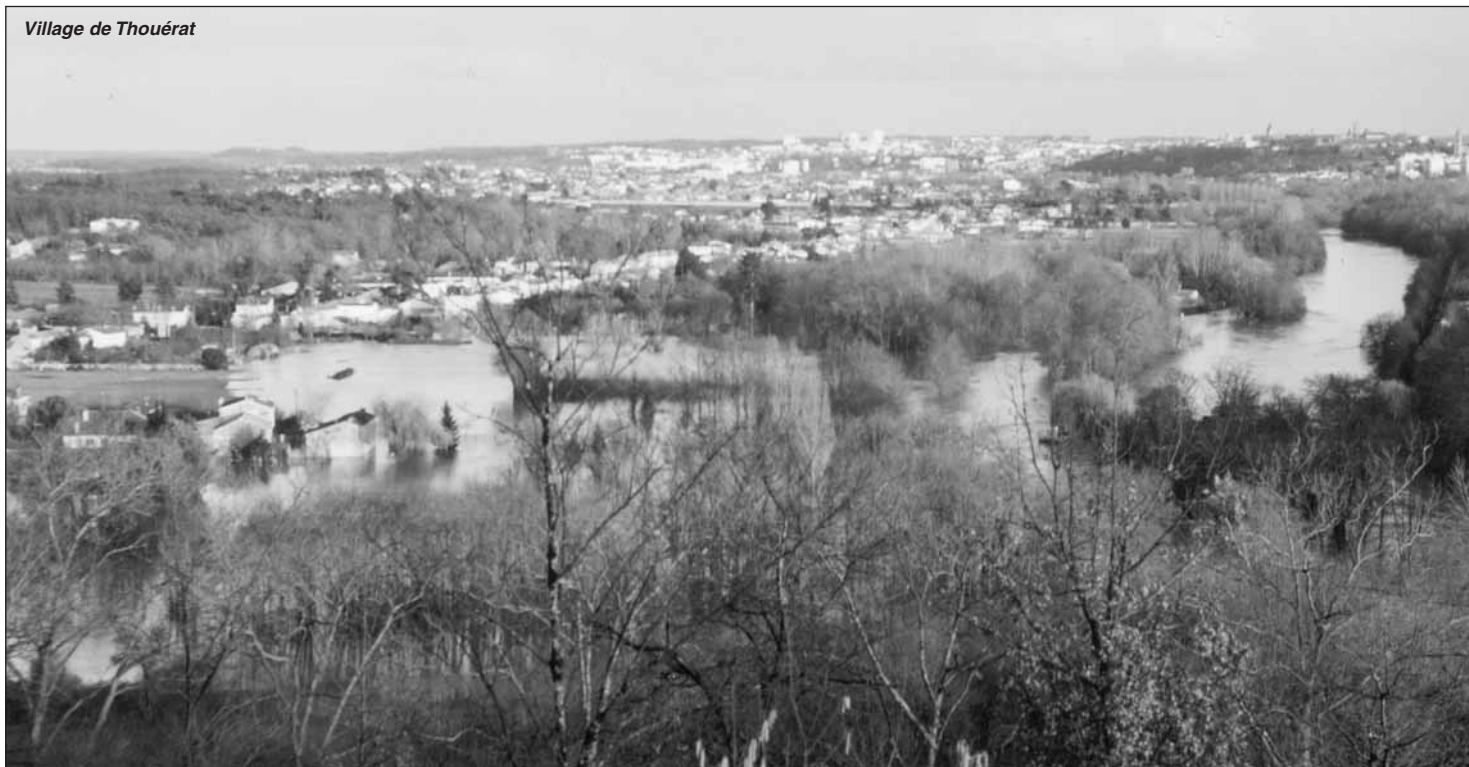
Village de Thouérat

Journal municipal d'informations et de liaison - Mairie de Fléac : 05 45 91 04 57 E.mail : mairiefleac@wanadoo.fr - Site Internet : www.fleac.fr