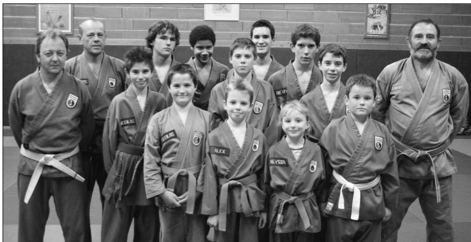
Coupe de France 2007 : 11 jeunes à l'honneur