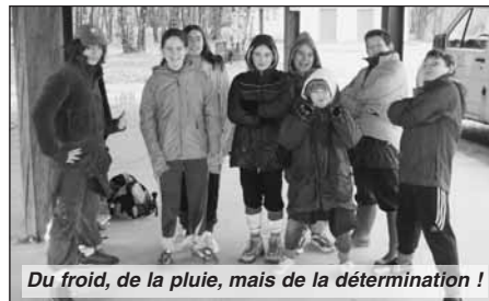
Du froid, de la pluie, mais de la détermination !

Ainsi, alors que les beaux jours arrivent, la Maisonnée se prépare à «bien manger» et à «bien bouger» les deux thèmes retenus pour avril ; tandis que l'Embarcation se positionne dans une démarche de nature et découverte.