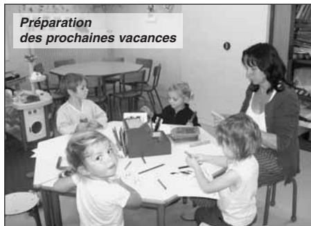
Préparation des prochaines vacances

F ort des vacances de février, la fréquentation est en hausse et les inscriptions pour les prochaines vacances d'avril donnent des signes d'une croissance annoncée.