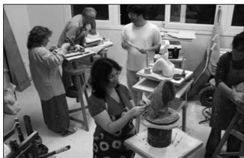
Atelier «Onde de choc»

Vous aurez tout loisir de vous initier aux différents ateliers qu'ils soient pierre ou glaise.