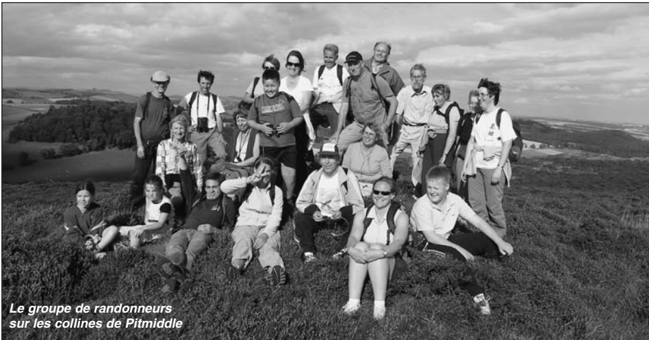
Le groupe de randonneurs sur les collines de Pitmiddle