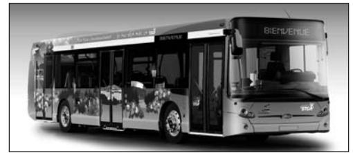
Bus aux couleurs de l'Agglo

L'équipe de la STGA vous accueillera au Centre Bus 554, route de Bordeaux - 16000 Angoulême Renseignements : 05 45 65 25 25 ou infos.clients@stga.fr