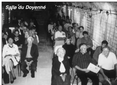
Salle du Doyenné

A travers leur aventure guyanaise, les visites aux Etats-Unis et spécialement en Louisiane, la fréquentation de salons littéraires en vogue, de sociétés secrètes et d'abolition-