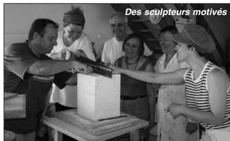
Des sculpteurs motivés

De 10h à 18h, sans interruption, les visiteurs pourront voir de nombreux travaux et les réalisations en cours, notamment le banc du jumelage (Confident) qui doit prendre place prochainement au bas des jardins de la mairie.