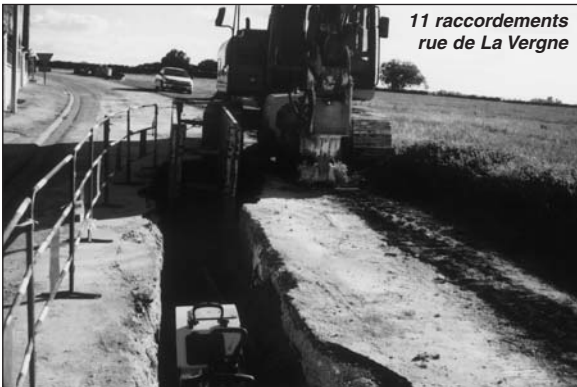
11 raccords rue de La Vergne

La Comaga poursuit son extension du réseau d'assainissement sur notre commune. C'est la portion de la rue de La Vergne allant de la RN141 au Cimetière, qui est enfin raccordable au tout à l'égout. Ces travaux sont faits de concert avec la SEMEA (Concession de l'Eau Potable) qui en profite pour remplacer son ancienne conduite d'eau potable qui était en fonte. Ces travaux sont très appréciés par les riverains, car les fosses septiques posées depuis bientôt quarante ans, ne remplissaient plus leur rôle d'assainissement.