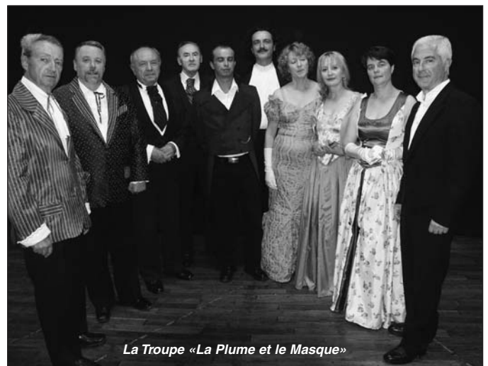
La Troupe «La Plume et le Masque»

Samedi 12 janvier 2008 à 21h Espace Franquin, Salle Bunuel à Angoulême