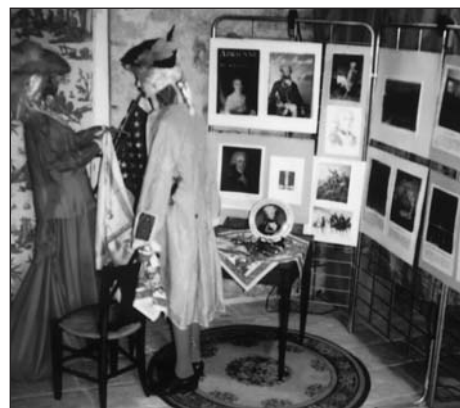
Exposition La Fayette

Conférence, débat et exposition se tenait à la salle voûtée du Doyenné, un vin d'honneur clôtura cette très intéressante soirée.