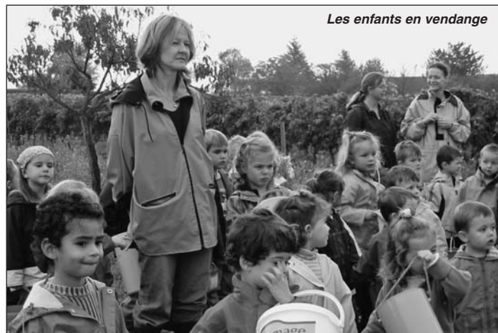
Les enfants en vendange

Ils ont été impressionnés par la machine à vendanger.