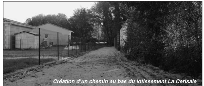
Création d'un chemin au bas du lotissement La Cerisaie

L'écoulement de l'eau pluviale, venant du Bois de la Vergne, en dessous du lotissement de la Cerisaie, avait été initialement prévu en fossé, à ciel ouvert. Afin d'éviter un entretien difficile de ce fossé, de sécuriser le lieu et surtout d'en profiter pour créer un passage piétonnier reliant l'impasse du Bois de La Vergne à la rue des Poignards, la commune a décidé de fermer ce fossé. Les services techniques ont donc posé une buse annelée en PVC de 600, permettant le raccordement du pluvial de La Cerisaie aux deux extrémités du chemin. La pose d'un regard a été nécessaire. L'empierrement en calcaire de 30, plus compactage ont permis la réalisation de ce nouveaux passage piétonnier. Une finition sera réalisée dans le courant de l'hiver.