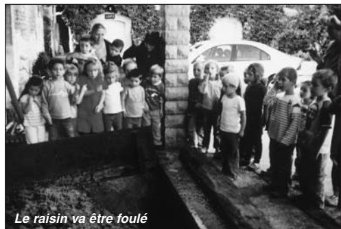
Le raisin va être foulé