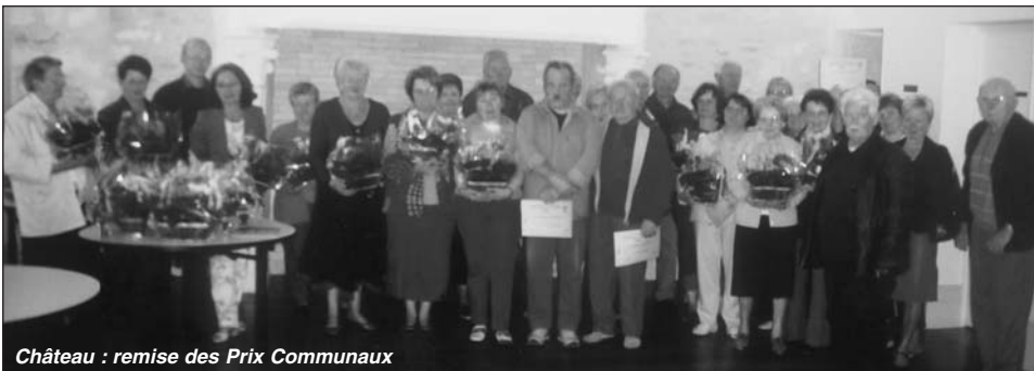
Château : remise des Prix Communaux

La remise des prix du Concours Communal des Maisons Fleuries s'est déroulé le lundi 8 octobre au cours d'un rassemblement amical dans la grande salle du château de Fléac.