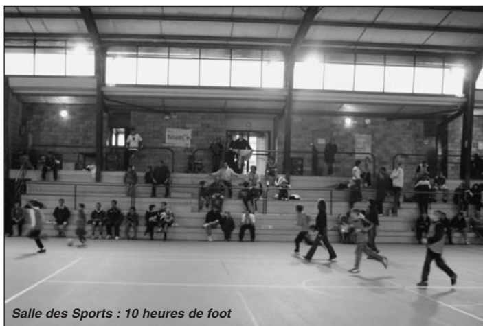
Salle des Sports : 10 heures de foot

Le samedi après midi, changement de décor, c'est sous une pluie continue, que les courageux marcheurs avec les clubs de marche de Linars et Fléac et les cyclistes, encadrés par le Fléac Amical Cyclo, se sont lancés avec témérité pour effectuer leur circuit.