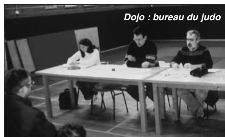
Dojo : bureau du judo

La section judo de la MJC a tenu son AG annuelle le 25/11/2007 au dojo de Fléac.