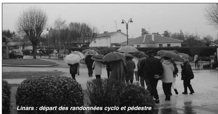
Linars : départ des randonnées cyclo et pédestre

A Linars, même dynamique, à partir de 17 heures, les enfants des écoles, l'AIPEL, le conseil municipal d'enfants, les démonstrations