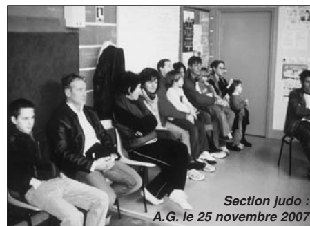
Section judo : A.G. le 25 novembre 2007

A l'issue de l'assemblée, tous les participants ont été conviés à prendre le verre de l'amitié et à partager un buffet campagnard.