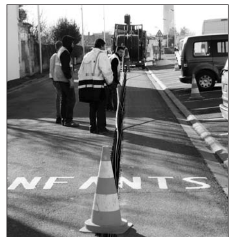
Rue Ste Barbe, passage de la fibre optique

Contactez directement les opérateurs télécom.