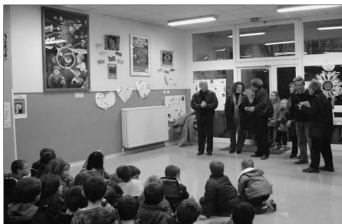
Préau Ecole Primaire : inauguration du «Mur des droits de l'enfant»