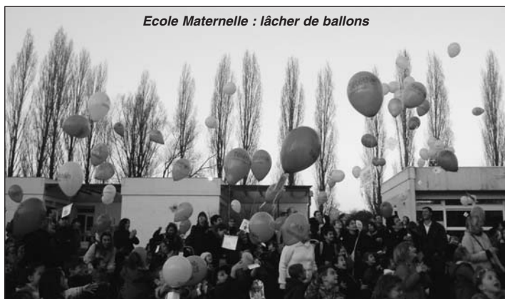
Ecole Maternelle : lâcher de ballons

Malgré le mauvais temps du week-end, qui a perturbé quelque peu les manifestations, votre générosité a été exemplaire, puisque nous atteignons cette année un chiffre record de 3 950 €. (Rappel dons 2006 : 2 950 €).