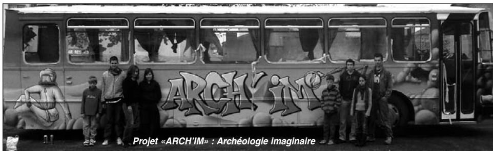
Projet «ARCH'IM» : Archéologie imaginaire

ainsi que dans les mairies des 3 communes et à l'accueil de la MJC.