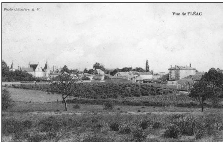
Carte postale ancienne de Fléac : Emplacement des écoles en 1906