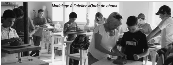
Modelage à l'atelier «Onde de choc»