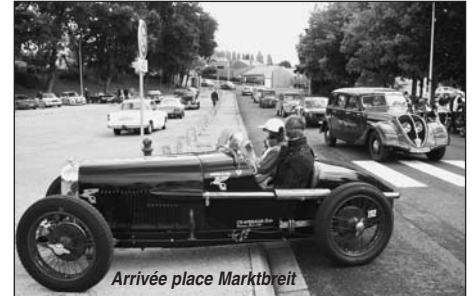
Arrivée place Marktbreit

La mobilisation continue et le prochain rendez-vous sera le dimanche 28 septembre , au plan d'eau de St Yrieix, autour des virades de l'espoir .