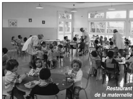
Restaurant de la maternelle

Le service de restauration met tout en œuvre pour que l'hygiène alimentaire soit assurée (la cuisine centrale vient d'obtenir le nouvel