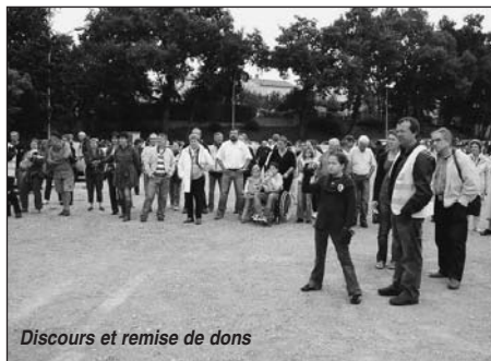
Discours et remise de dons

Ils ont souligné que «la recherche progresse, mais qu'il reste encore beaucoup à faire pour faire évoluer l'espérance de vie».