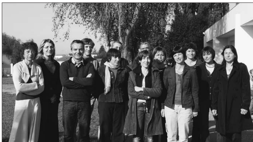
Ecole primaire : de gauche à droite