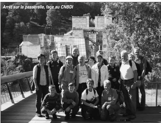
Arrêt sur la passerelle, face au CNBDI

Ce fut un très court séjour, mais avec un contenu thématique qui a séduit chaque participant. Une expérience que nos amis écosais nous avaient fait découvrir l'an dernier et que nous réitérerons. Rien de tel que de marcher ensemble pour échanger !