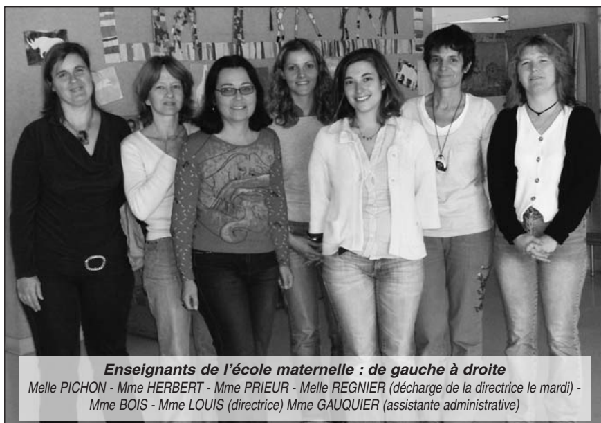
Enseignants de l'école maternelle : de gauche à droite