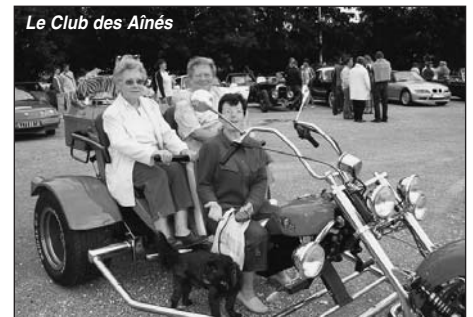
Le Club des Aînés