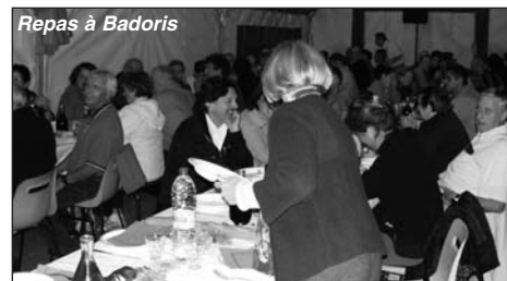
Repas à Badoris