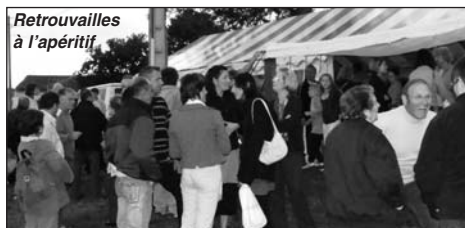
Retrouvailles à l'apéritif

C'est fait. Voilà une édition de ce traditionnel rendez-vous qui devrait rester dans les mémoires tant celles des organisateurs que des participants et au-delà des absents.