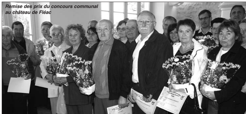
Remise des prix du concours communal au château de Fléac