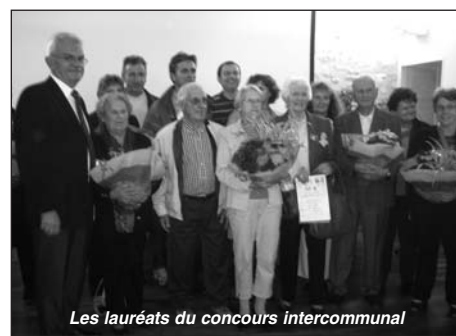
Les lauréats du concours intercommunal