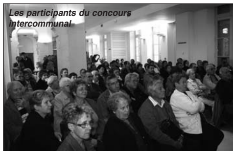
Les participants du concours intercommunal

Cette année, c'était Fléac qui avait le privilège d'accueillir les primés du concours intercommunal. Le jeudi 9 octobre, au Château, en présence des représentants des 7 communes : Puymoyen, La Couronne, Angoulême, Nersac, Linars, St Michel et Fléac.