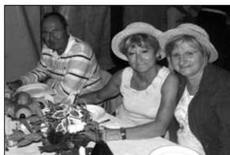
Repas à Bellegarde