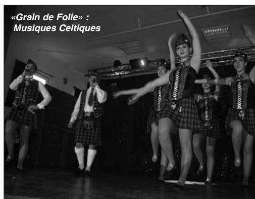
«Grain de Folie» : Musiques Celtiques