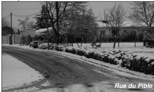
Rue du Pible

Trois personnes composaient l'équipe d'intervention avec un camion traiteur (1 chauffeur et 1 répandeur) et 1 véhicule de ravitaillement en sel.