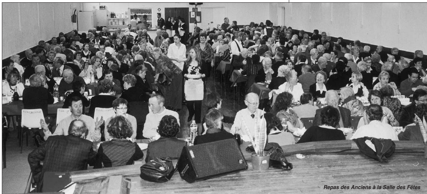
Repas des Anciens à la Salle des Fêtes