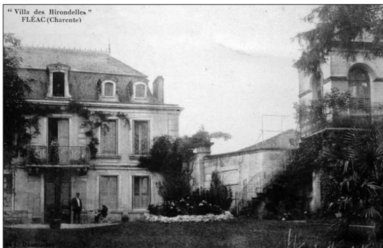
Carte postale ancienne de Fléac : Villa des Hironnelles (rue du Château)