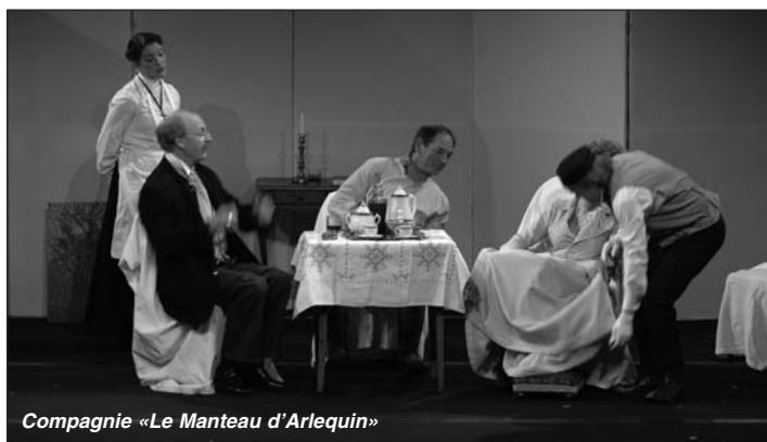
Compagnie «Le Manteau d'Arlequin»

Ce ne sont pas moins de douze comédiens sur scène. La compagnie «Le Manteau d'Arlequin» jouera ce dimanche, la pièce de TCHEKHOV « La Cerisaie » dans une adaptation de M. J. GOUGUET.