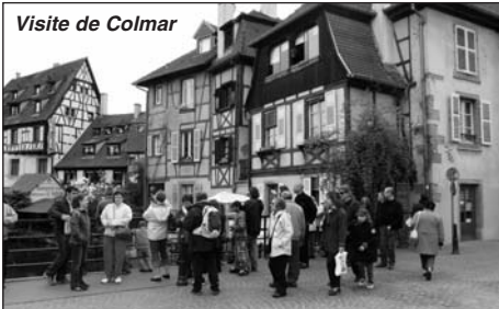
Visite de Colmar

Une première étape nous conduit dans l'après-midi à Colmar où, avec le soleil, nous pouvons visiter la vieille ville avant de rejoindre l'hôtel puis le restaurant pour un dîner typiquement alsacien.