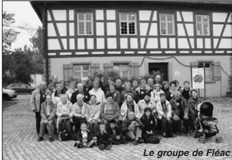
Le groupe de Fléac

comité de Marktbreit. Nous partons ensuite passer la soirée dans nos familles d'accueil. Jeudi matin, à 10h, accompagnés de quelques familles, nous avons rendez-vous à 10h pour partir en bus visiter le «Fränkisches Freilandmuseum» à Bad Windsheim.