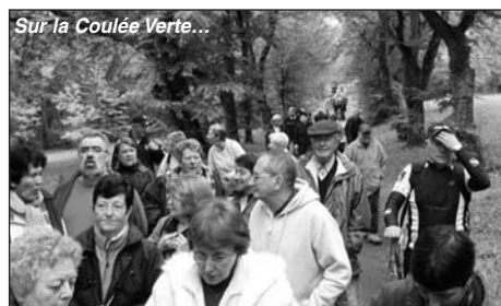
Sur la Coulée Verte...

Au départ de la salle des fêtes, le circuit nous a fait découvrir ou redécouvrir le Logis de Chalonne, pour poursuivre le long de la coulée verte jusqu'à St Cybard, point extrême avant le retour.