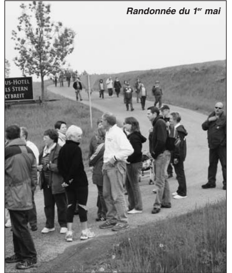
Randonnée du 1 er mai

En début d'après-midi, une réunion de travail réunit les membres des bureaux des comités de nos deux villes pendant que chacun repart avec sa famille pour une après-midi libre, consacrée aux différents villages voisins ou même à Würzburg, et une dernière soirée en famille.