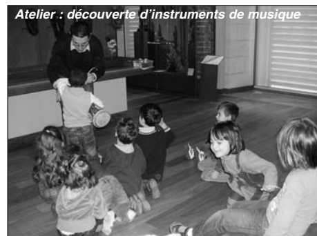
Atelier : découverte d'instruments de musique

marionnettes en bois et d'instruments de musique, empreintes dans la terre etc. Les enfants ont ensuite travaillé à l'école.