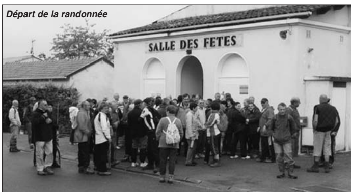
Départ de la randonnée

Avec un temps couvert, mais très agréable pour la randonnée, le décor était planté pour la réussite de cette