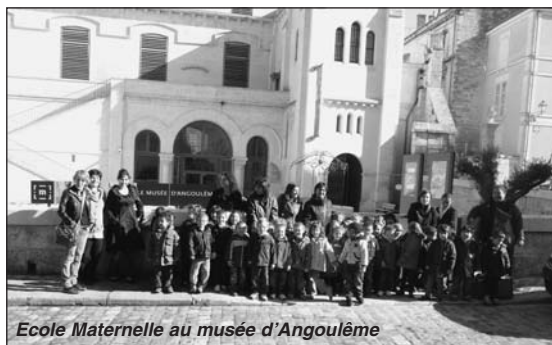
Ecole Maternelle au musée d'Angoulême