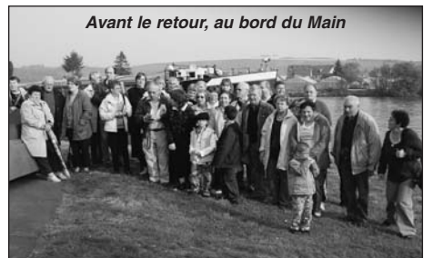
Avant le retour, au bord du Main

En ce matin du samedi 2 mai, à 8 h, le cœur un peu triste malgré le soleil, nous sommes tous réunis au bord du Main pour une dernière photo avant le retour à Fléac vers 23h30.