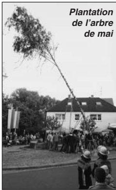
Plantation de l'arbre de mai

Un délicieux déjeuner typique conclut cette visite. A notre retour à Marktbreit, nous disposons d'une petite pause réparatrice avant de nous retrouver, avec nos familles d'accueil, au village voisin d'Obernbreit où a lieu la traditionnelle plantation de l'arbre de mai, accompagnée de chants et danses d'enfants des écoles maternelles auxquelles participent petits et grands enfants de Fléac. La soirée se termine en plein air autour de saucisses arrosées de bière.