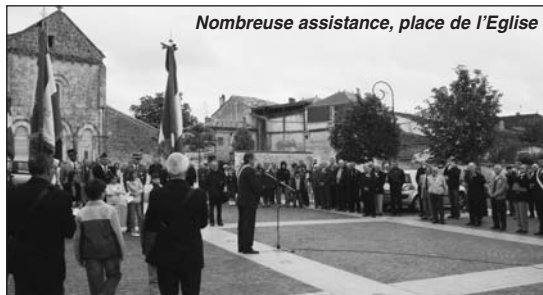
Nombreuse assistance, place de l'Eglise

Cette année encore, une très nombreuse assistance a participé à la commémoration du 64 ème anniversaire d'armistice du 8 mai 1945.