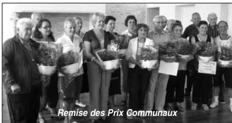
Remise des Prix Communaux

Lors de son passage le mercredi 8 juillet, le jury, a retenu 22 participants.