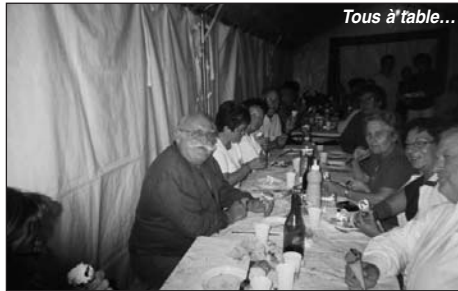
Tous à table...

Si nos «gars» sont là au montage, les «filles» sont aux manettes pour les décors, elles ont bien