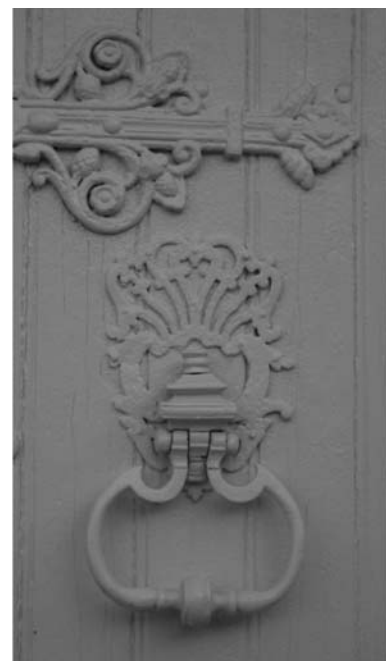
Heurtoir et ferrure porte du château

Ouvert gratuitement à tous les amateurs de 7 à 77 ans & +