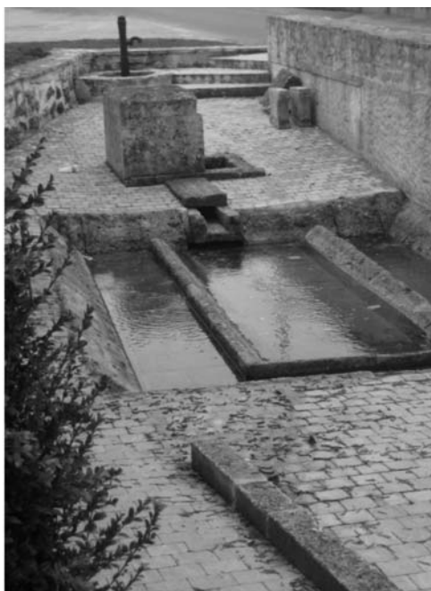
Fontaine «La Vallade»