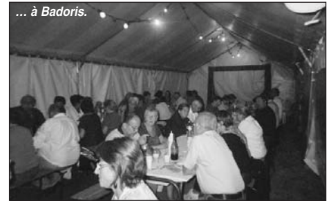
... à Badoris.

Ainsi, Eole avait décidé de ne pas lâcher sa main mise sur la journée.