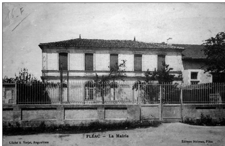
Carte postale ancienne de Fléac : Ancienne Mairie, MJC actuellement.