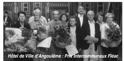
Hôtel de Ville d'Angoulême : Prix Intercommunaux Fléac

La soirée a été clôturée par un magnifique diaporama, d'une vingtaine de minutes, concocté par Jacques Moulys, auquel il faut associer Jean Louis Lebras pour la musique. Un grand merci à tous les deux et surtout félicitations à vous tous, participants, pour votre travail de fleurissement.