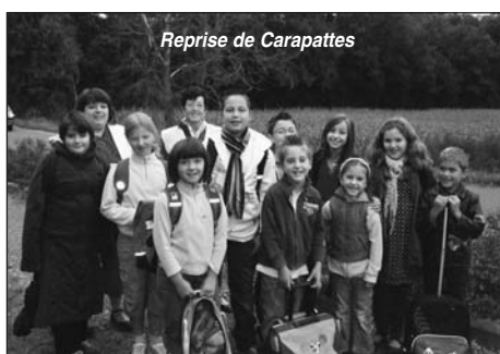
Reprise de Carapattes

Depuis le premier octobre, Carapattes a repris du service sur sa ligne habituelle entre les Pierrailles et l'école. Des élèves encadrés par des adultes se rendent à l'école et en repartent à pied. Ce redémarrage a été possible grâce à une convention signée entre la FCPE, la MJC et l'école et le soutien de la municipalité (1 500 €). Il est encore temps de s'inscrire auprès de l'école pour les enfants ou pour les adultes (parents d'élèves ou non) qui souhaitent participer à l'encadrement bénévole.