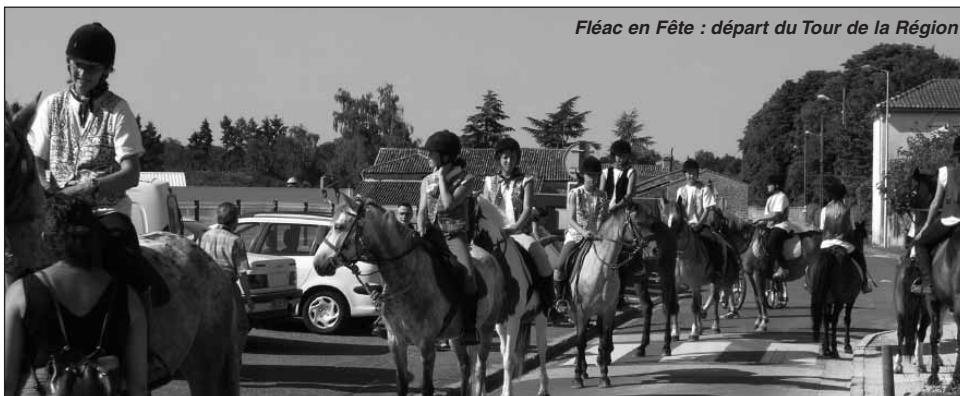
Fléac en Fête : départ du Tour de la Région

Le rendez-vous est pris le mois prochain, pour vivre une rétrospective complète de cette formidable épopée moderne!