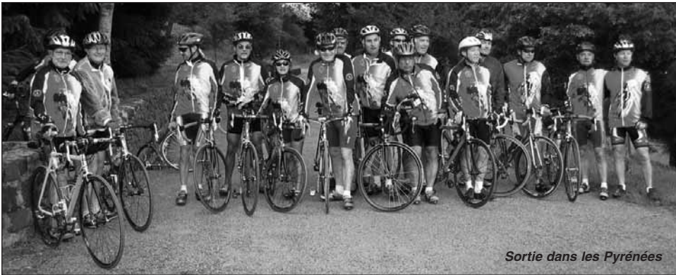
Sortie dans les Pyrénées