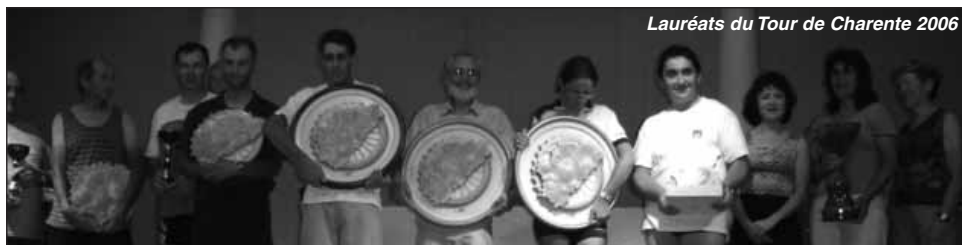
Lauréats du Tour de Charente 2006