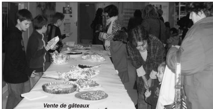
Vente de gâteaux