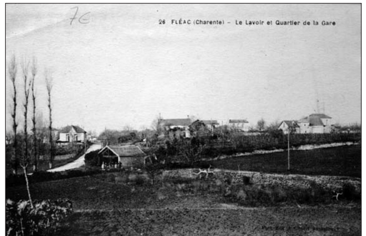
Carte postale ancienne de Fléac : Le Lavoir