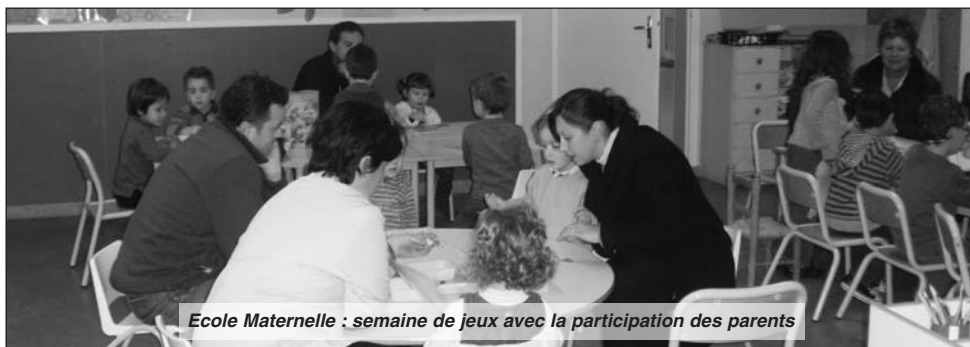
Ecole Maternelle : semaine de jeux avec la participation des parents

Les enfants, les parents et le personnel de l'école ont été ravis de partager ce moment éducatif et convivial.