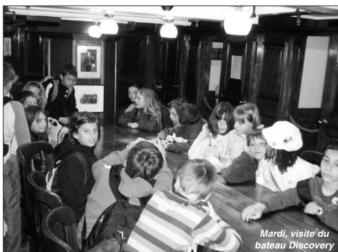
Mardi, visite du bateau Discovery

Le Discovery est un bateau en bois à 3 mâts qui a été construit à Dundee pour réaliser des expéditions scientifiques. Il fut lancé en mars