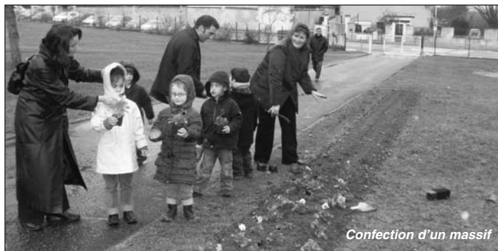
Confection d'un massif

Cette édition 2009 a permis de récolter sur nos deux communes : 3 200 €.