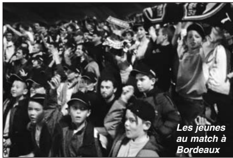
Les jeunes au match à Bordeaux

A titre d'exemple, le 31 octobre 2009, une cinquantaine d'enfants dont une quinzaine de jeunes adolescents des communes de Fléac, Linars et de Saint Saturnin, ont pu assister au match de football «Bordeaux-Monaco» au stade Chaban Delmas. Depuis, les jeunes ne