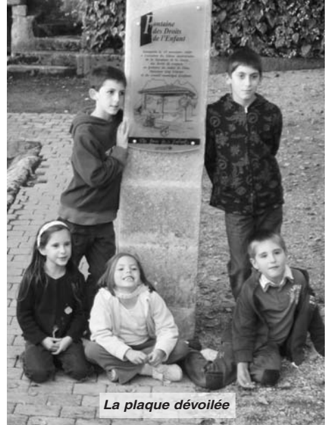
La plaque dévoilée

C'est un constat alarmant. Pourtant, grâce aux efforts de tous, les chiffres de ces indicateurs reculent.