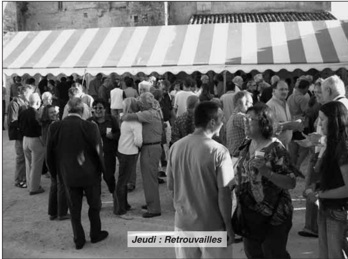
Jeudi : Retrouvailles

F léac a célébré le dernier week-end d'Août les 20 ans de jumelage avec Marktbreit; 80 personnes étaient venues de notre ville amie de Bavière, et 10 écossais de notre ville jumelée d'Ecosse, Inchture, s'étaient joints à la fête. L'hébergement a eu lieu en famille, -beaucoup se connaissent depuis 20 ans- et il n'a pas été difficile de trouver de nouvelles familles pour accueillir les nouveaux venus.