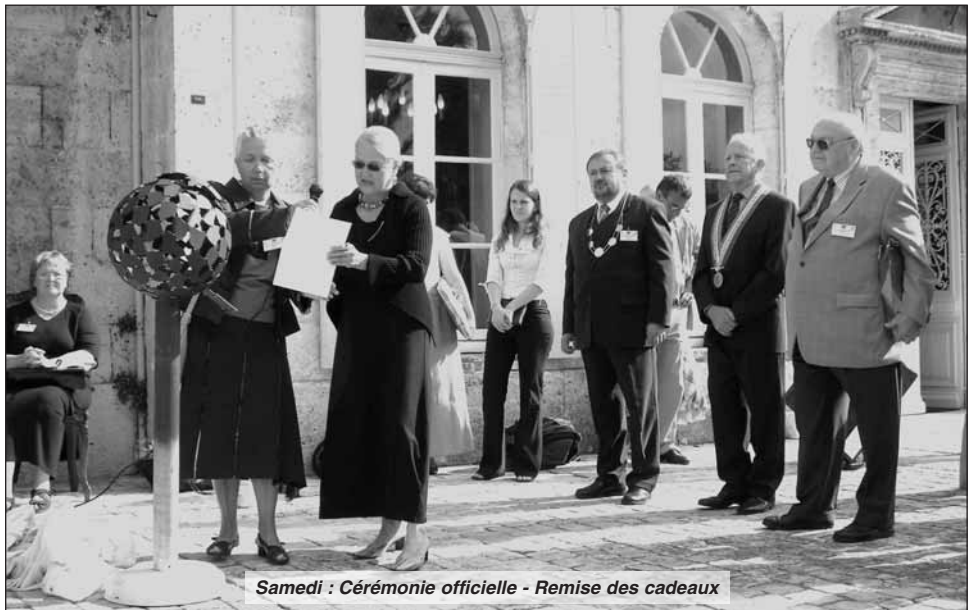
Samedi : Cérémonie officielle - Remise des cadeaux

on a pu cependant voir commencer les travaux de taille de la pierre qu'Onde de Choc va transformer en «banc du jumelage». Le reste des activités a été rapatrié à la hâte autour de la salle des fêtes. Le rémouleur, la dentellière, la fileuse, les bijoux anciens, le vannier, l'orgue de Barbarie, pour lesquels des espaces avaient été aménagés