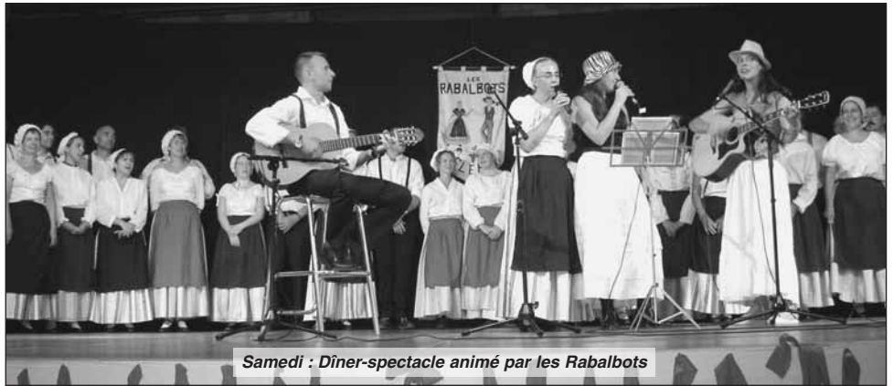
Samedi : Dîner-spectacle animé par les Rabalbots