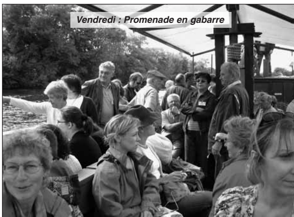
Vendredi : Promenade en gabarre