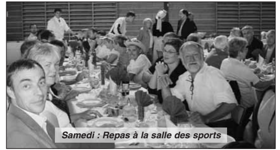
Samedi : Repas à la salle des sports

Mais les «Randonnées fluviales» avaient mis à notre disposition canoës et barques, des artistes du Club de peinture devaient être là et peindre devant nous... tout cela n'a pu avoir lieu. Dans l'après-midi