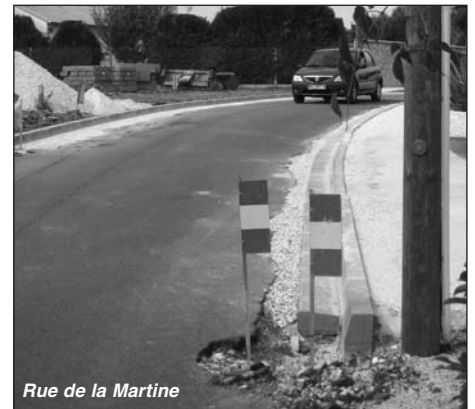
Rue de la Martine

Afin d'améliorer la sécurité des riverains et des piétons des travaux sont en cours rue de la Martine. Pose de bordures de trottoir, renforcement de la chaussée. La fin des travaux est programmée pour la fin de l'année.