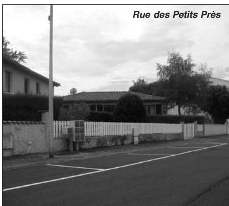
Rue des Petits Prés

Pour éviter le stationnement sur les trottoirs au carrefour (rue des Petits Prés et de l'avenue des Plantes) les services techniques ont matérialisé des nouvelles places de parking sur la rue des Petits Prés.