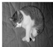
Le repos de « Pacha »

Différents artistes Charentais présenteront leurs œuvres dans le cadre d'une exposition et d'un concours photos sur le thème des animaux vivants.