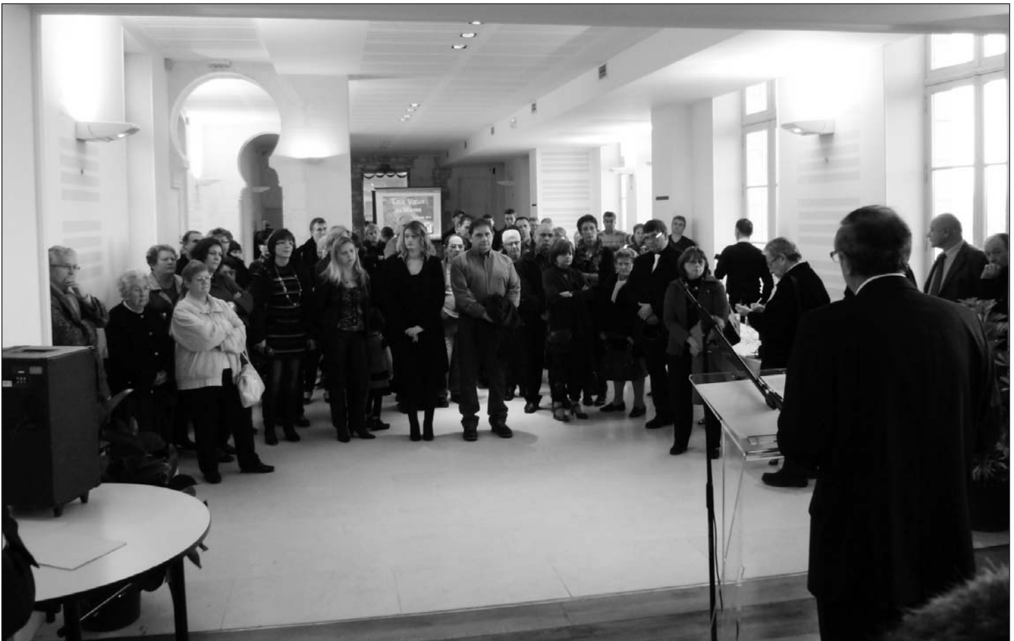
Château de Fléac, le samedi 15 janvier

Journal municipal d'informations et de liaison - Mairie de Fléac : 05 45 91 04 57 E.mail : mairiefleac@wanadoo.fr - Site Internet : www.fleac.fr