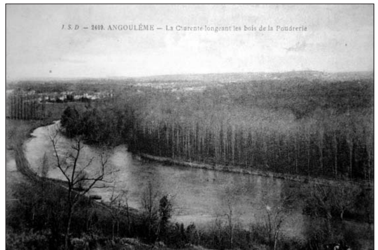
Vue de la Côte Saint-Barbe