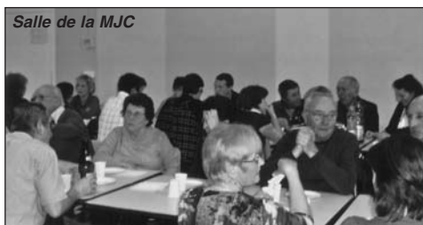
Salle de la MJC

Réunis à la salle de la MJC, nous étions une quarantaine de personnes. Après la dégustation de la galette, le reste de la soirée s'est passé à jouer avec les jeux de société. Cette soirée a été très appréciée par tous les participants.