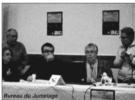
Bureau du Jumelage