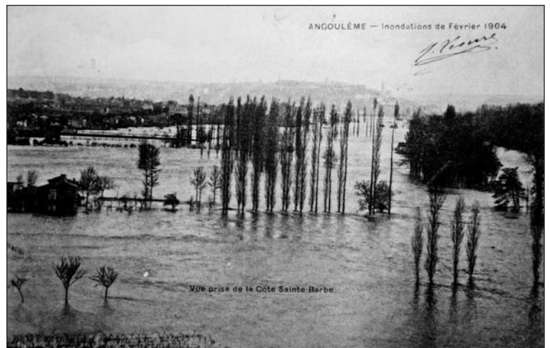
Inondation à Thouérat en 1904