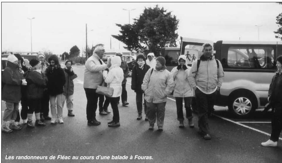
Les randonneurs de Fléac au cours d'une balade à Fouras.

Pour tous les amateurs de la marche, deux fois par semaine, vous pouvez retrouver le groupe des marcheurs pour un départ de randonnée, au centre commercial, le mardi matin à 08h30 ou le samedi après midi à 14h00.