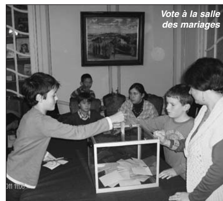
Vote à la salle des mariages