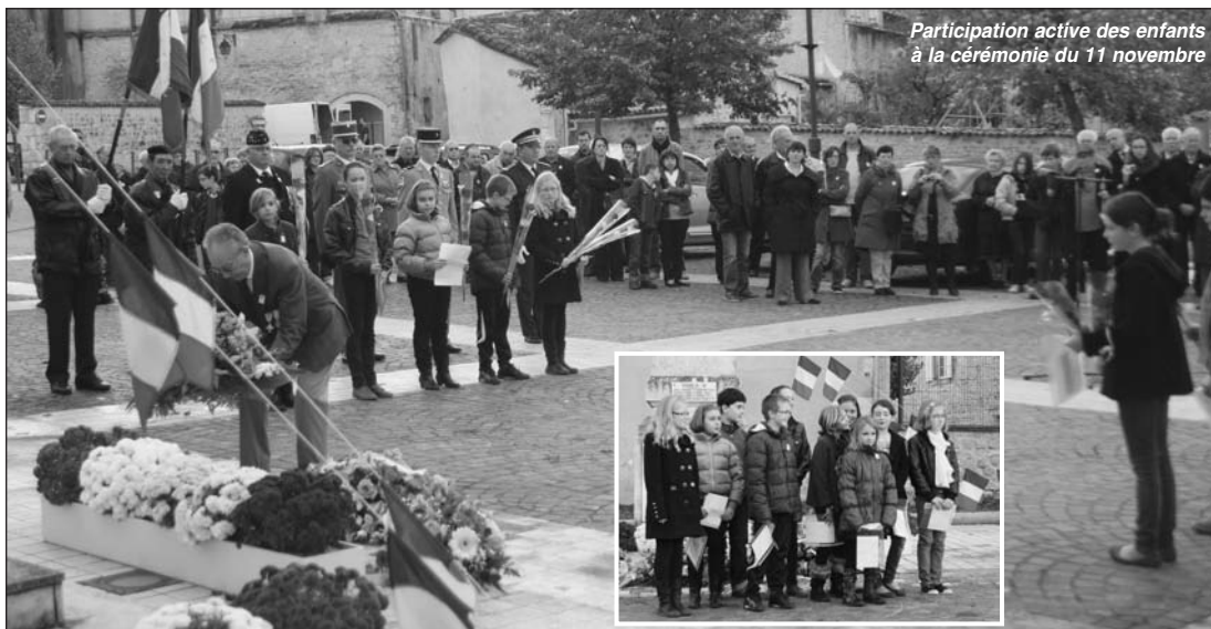
Participation active des enfants à la cérémonie du 11 novembre

Le maire et les responsables des deux sections d'anciens combattants ont remercié le nombreux public présent et tout particulièrement les élèves des écoles, leurs enseignants, le conseil municipal des enfants, les militaires, les anciens combattants et les élus.