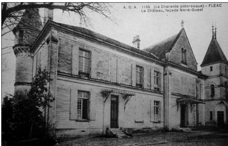
Le Château de Fléac (façade Nord-Ouest)