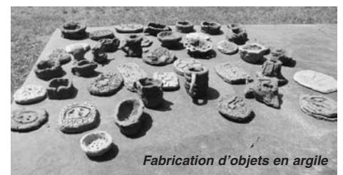
Fabrication d'objets en argile