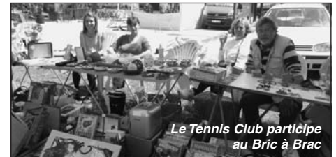
Le Tennis Club participe au Bric à Brac