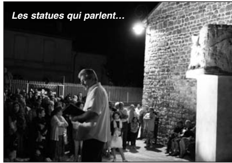
Les statues qui parlent...