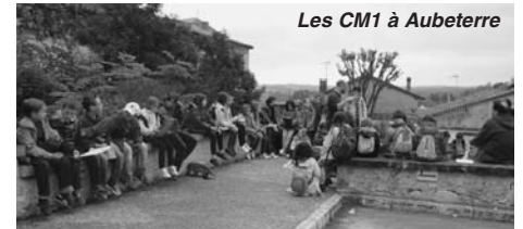
Les CM1 à Aubeterre