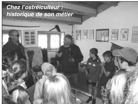
Chez l'ostréiculteur : historique de son métier

Mercredi , quelques élèves français et tous les Allemands sont partis à l'île d'Oléron. Un ostréiculteur nous a expliqué son métier, nous a raconté la culture des huîtres d'autrefois à nos jours. Il nous a dit comment elles se reproduisent et grandissent jusqu'à la vente. Nous avons vu le matériel utilisé (même celui d'autrefois) et il nous a présenté des coquilles d'huîtres d'espèces différentes, disparues ou non, et même des fossiles. Les adultes ont pu déguster!