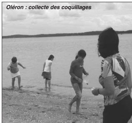
Oléron : collecte des coquillages

Ensuite, nous nous sommes promenés au marché de pays au port des salines. C'est aussi à cet endroit que nous avons pique-niqué. L'après-midi, nous avons joué sur la plage : certains élèves ont dessiné ou sculpté des fruits dans le sable, d'autres ont fait une partie de football, les enfants allemands ont récolté des coquillages et tout le monde s'est baigné... jusqu'aux genoux!