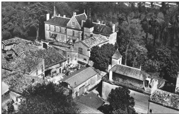
Fléac - Le Château