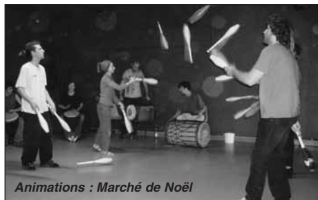
Animations : Marché de Noël

Cet atelier, qui s'inscrit dans le cadre du quarantième anniversaire de la MJC (cofinancé par le Conseil Général, la DDJS et le soutien de l'Union Départementale des MJC), est le point de départ d'un travail autour de la mémoire qui va démarrer dès ce mois-ci.