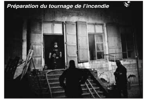
Préparation du tournage de l'incendie

Pour les besoins du scénario, il s'agissait de tourner une scène d'incendie avec intervention des pompiers. En amont, un très important travail a été nécessaire pour recréer un intérieur cossu d'une maison d'habitation. Parquet flottant, tapisseries et mobiliers ont redonné vie au Logis de Chalonne. Temporairement, car pour les besoins du film, un vio-