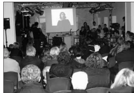
Plateau télé : Retour de la région

La compilation de cette expérience unique en France sous la forme d'un Documentaire, Clip vidéo, Articles de presse et Photos est proposée à la vente pour favoriser la création de nouveaux projets et garder une trace vivante (à valeur d'exemple) pour tous ceux qui veulent traduire leurs idées en réel projet!