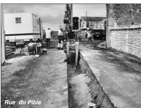
Rue du Pible

Les travaux réalisés par la Comaga ont été fort bien accueillis par les riverains du secteur du Pible. Ces aménagements (tranchée de 221ml) permettent le raccordement en eaux usées de 9 nouvelles habitations et de renforcer le réseau eau potable existant pour 8 logements.