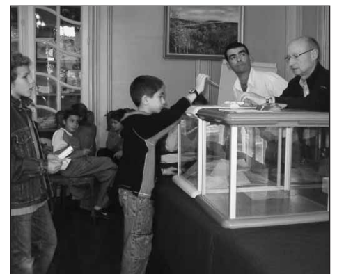
Bureau de vote : Salle des Mariages