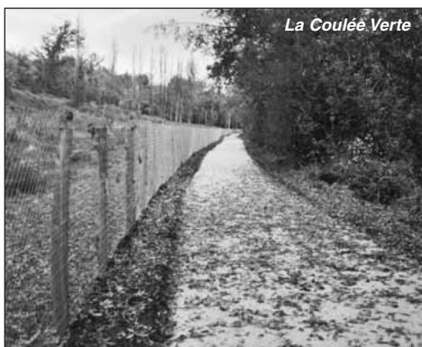
La Coulée Verte

Après décaissement, apport de calcaire 0-30 et compactage des matériaux, les promeneurs pourront encore mieux apprécier la douceur et le calme de notre fleuve Charente.