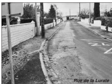
Rue de la Lurate

Cette nouvelle desserte permet à 7 habitations du quartier d'être raccordables au réseau d'assainissement collectif.