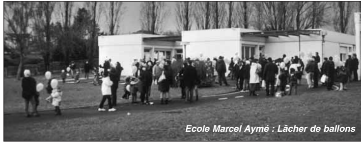
Ecole Marcel Aymé : Lâcher de ballons

L'ayant appris trop tard, et des manifestations organisées par la MJC étant déjà programmées, il a fallu adapter le programme et recentrer les actions plus particulièrement sur Linars.