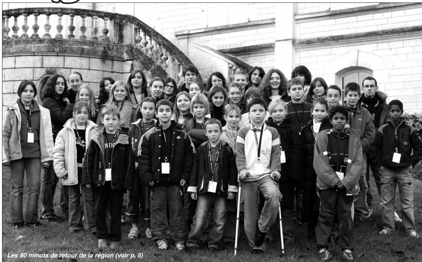
Les 80 minots de retour de la région (voir p. 5)

Le Conseil Municipal et l'Equipe du Journal vous souhaitent d'excellentes fêtes et vous présentent leurs Meilleurs Vœux pour l'année 2007.