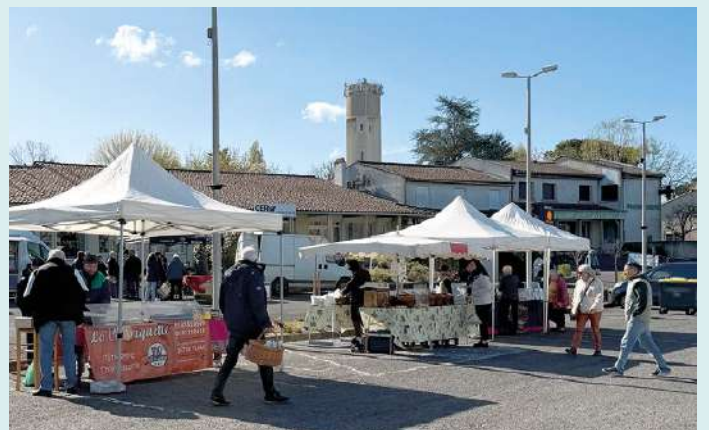
Marché de printemps le 29 mars