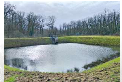
Bassin de la DIRA le 12 février

La solidarité s'est exprimée largement lors de cet épisode de crue, nous remercions toutes celles et ceux qui ont apporté leur aide.