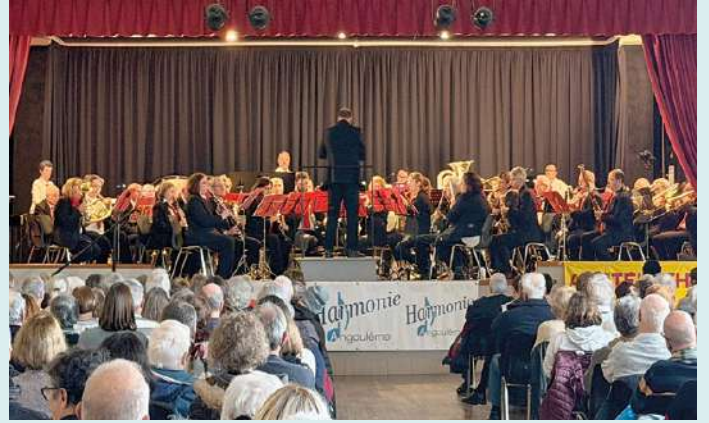
Concert de l'Harmonie d'Angoulême au profit du Téléthon le 17 janvier