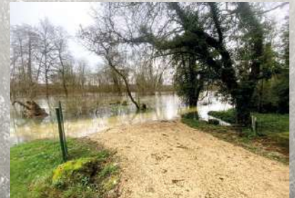
La Coulée Verte