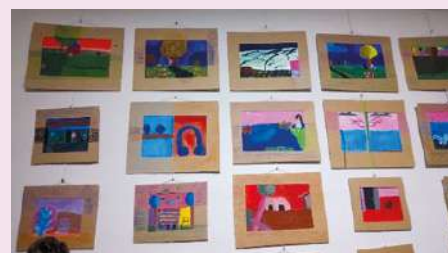
Vernissage Musée d'Angoulême