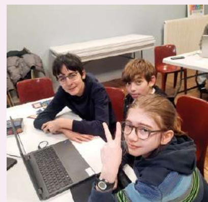
Préparation de la soirée gaming du 7-03-26