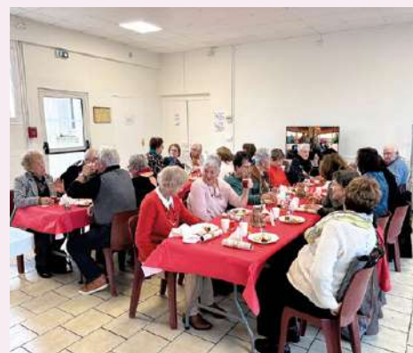
Repas fin d'année Monalisa le 22-12-25