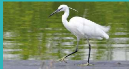
Aigrette garzette

A l'échelle nationale les effectifs sont en forte évolution depuis 1993. Ceci démontre bien que certaines espèces peuvent encore s'adapter à leurs milieux agricoles mais également augmenter leur population grâce à des plans de sauvegarde mis en place par les associations de protection de l'environnement.