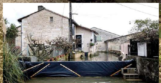
Installation des batardeaux par les services techniques le 14 février