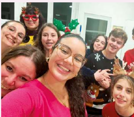
Secret santa et soirée pull moche de Noël le 19-12-25