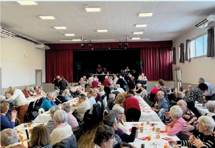
Gôûter musical des aînés le 31 janvier