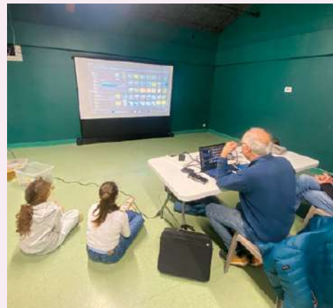
Zoom sur le projet photo de la MJC