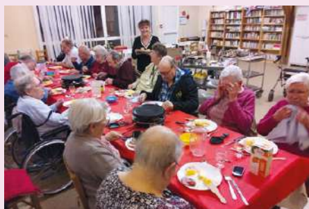
Soirée raclette à l'EHPAD