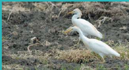
Héron garde-bœufs

On l'observe souvent en colonie dans les labours frais ou bien en compagnie de bétail comme son nom l'indique, à la recherche de vers et de larves.