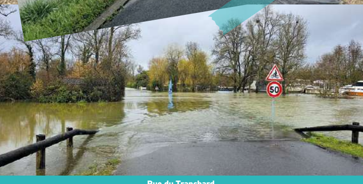
Rue du Tranchard