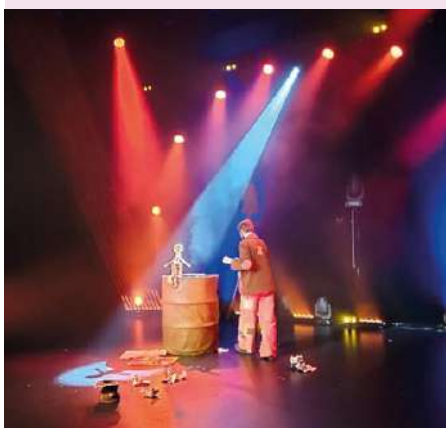
Le festival du rire et de l'humour à Ruffec