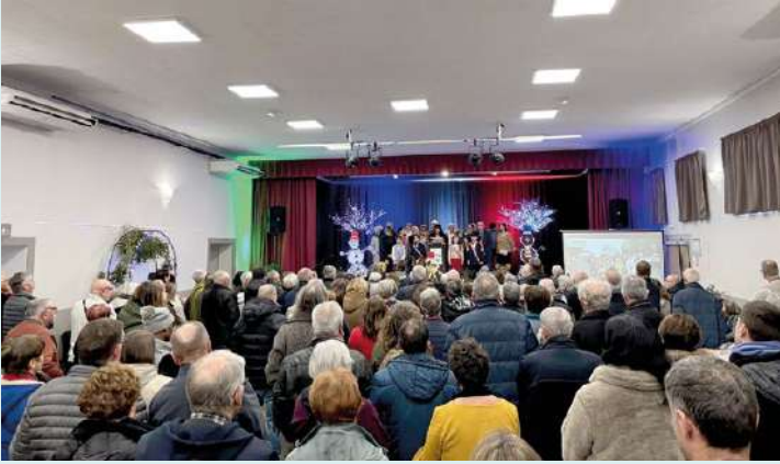
Vœux du Maire le 9 janvier