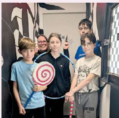
Les vacances à l'Accueil Jeunes du 9 au 20-02-2026