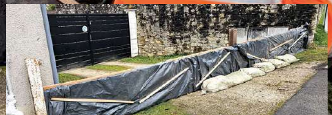
Installation des batardeaux par les services techniques le 14 février