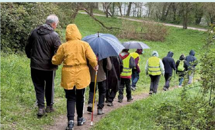
Marche chiens guide d'aveugle le 28 mars