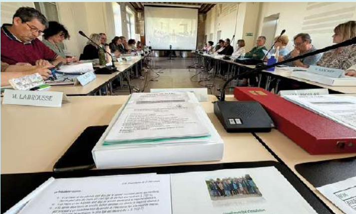
Conseil Municipal d'installation le 21 mars