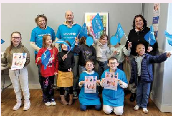
Les enfants du centre de loisirs s'engagent avec l'UNICEF Consultation le 9-02-26