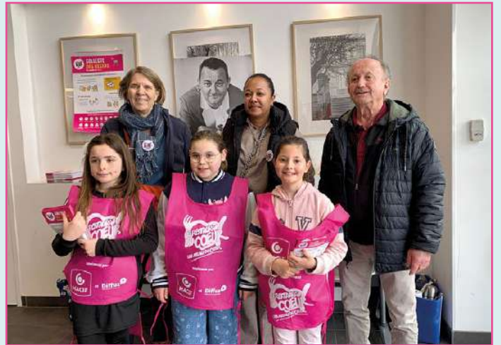
Collecte du CME au profit des restaurants du cœur le 7 mars