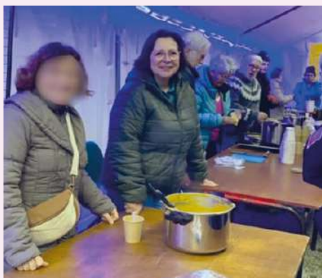
Fléac Fête Noël le 13-12-25