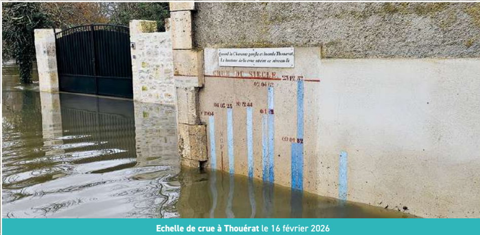
Echelle de crue à Thouérat le 16 février 2026