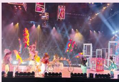
Holiday on Ice à Bordeaux